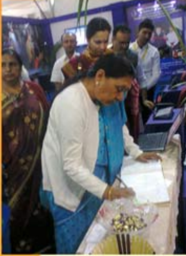
મંત્રીશ્રીનો પ્રોત્સાહક પ્રતિભાવ