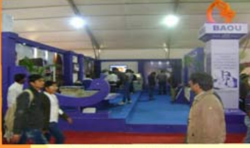
આપણું એજ્યુકેશન પેવેલિયન