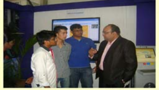
નિયામકશ્રીનો વિદ્યાર્થીઓ સાથે સંવાદ