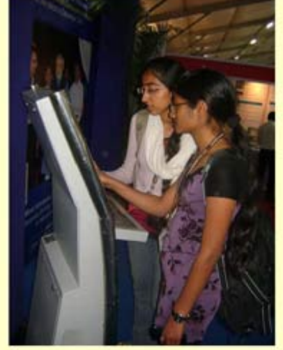
ટેકનોલોજીના સથવારે વિદ્યાર્થી સાથે સેતુબંધ