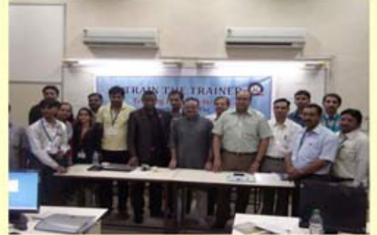
CCC-BAOU "ટ્રેઈન ધ ટ્રેનર"