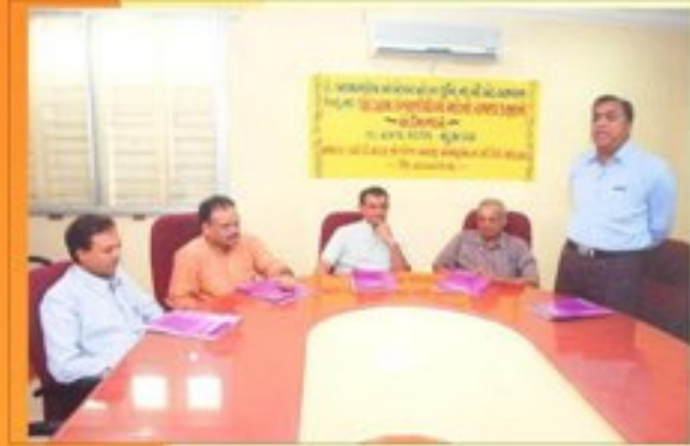
બી.એડ. પ્રોગ્રામ ઈન્ચાર્જશ્રીઓનો સેમિનાર

ડૉ. બાબાસાહેબ આંબેડકર ઓપન યુનિવર્સિટી બી. એડ. અભ્યાસક્રમ વિભાગના પ્રોગ્રામ ઈન્ચાર્જશ્રીઓ માટેનો રાજ્યકક્ષાનો સેમિનાર સંપન્ન થયો.