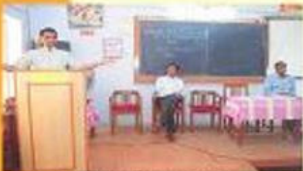
બી.એ.સી. સર્વિસ ઈ-વાર્ડ પોલોસ્ટી-બી સેરિસ