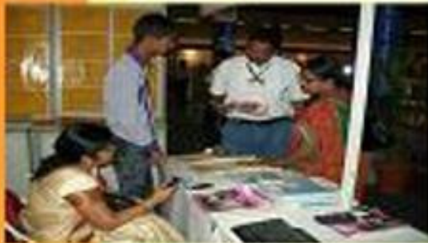
જાનકિ સર્કલ, મુલ