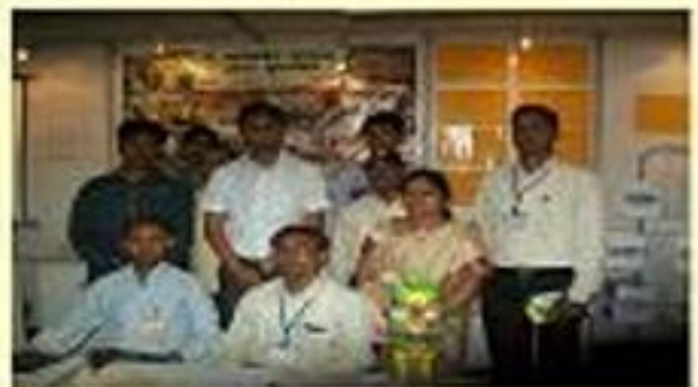
જાનકિ સર્કલ, મુલ