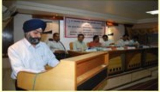
અભિમુક્તા કાર્યક્રમ મહેસાણા