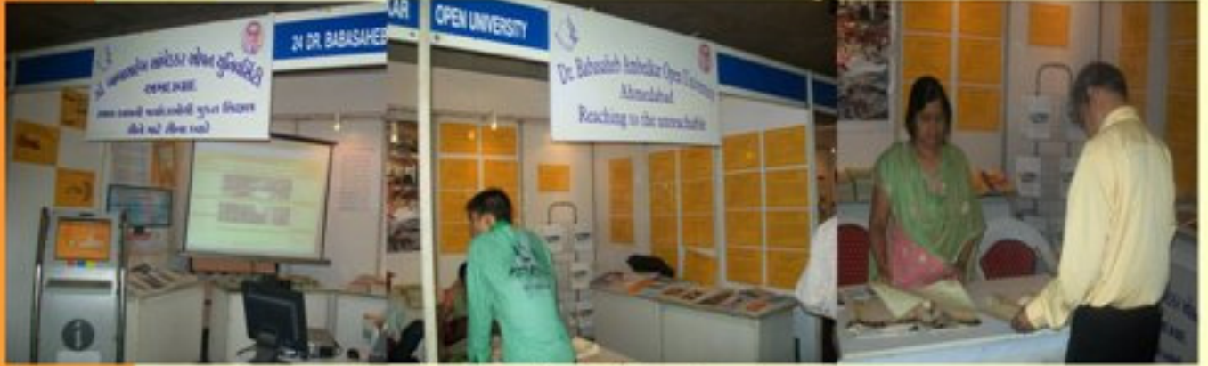
ડૉ.બાબાસાહેબ આંબેડકર ઓપન યુનિવર્સિટી જ્ઞાનશક્તિ પ્રદર્શન

આ જ્ઞાનશક્તિ પ્રદર્શનમાં ગુજરાત રાજ્યની તમામ યુનિવર્સિટીઓ, KCG અને અન્ય સંસ્થાઓએ ભાગ લીધેલ. આ