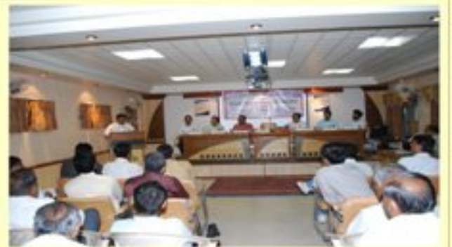
અભિમુખતા કાર્યક્રમનો શ્રોતાગણ