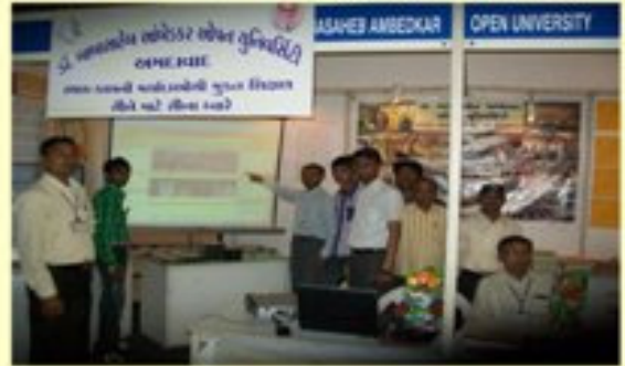
જ્ઞાનશક્તિ પ્રદર્શન સુરત