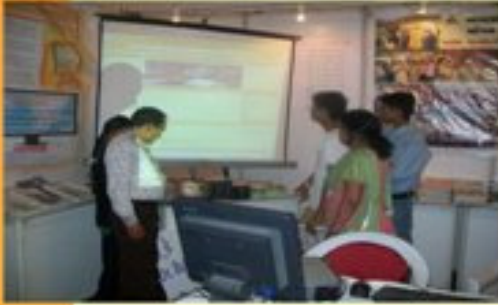
જ્ઞાનશક્તિ પ્રદર્શન સુરત