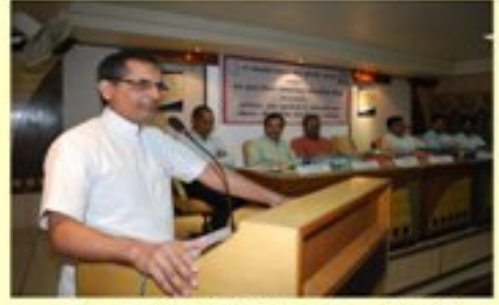
અભિમુક્તા કાર્યક્રમનું ઉદ્ઘોષન કરતા મા.કુલપતિશ્રી