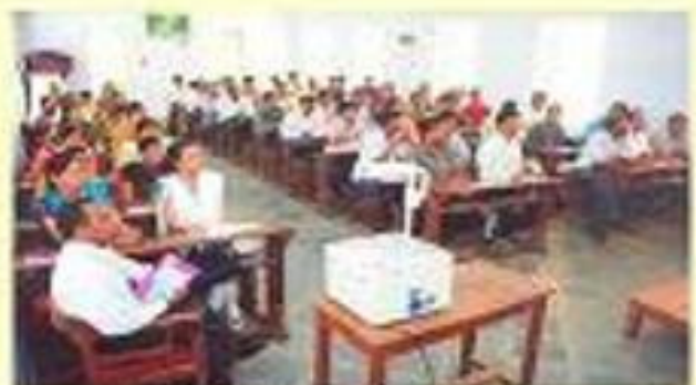
બી.એ.સી. સર્વિસ ઈ-વાર્ડ પોલોસ્ટી-બી સેરિસ