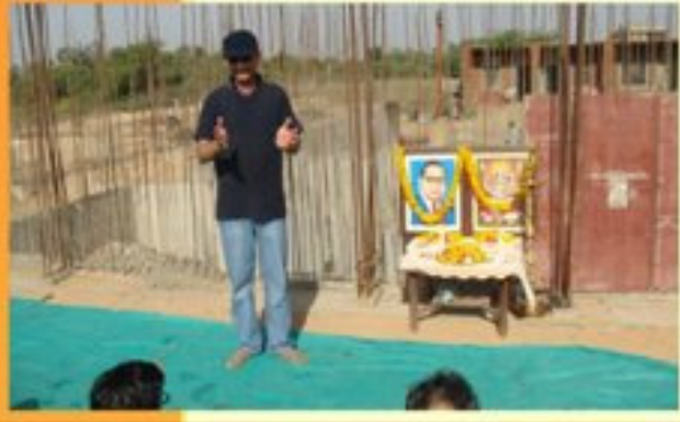
શ્રમદાન યજ્ઞમાં વક્તવ્ય આપતાં મા.કુલપતિશ્રી

આ શ્રમયજ્ઞ ડૉ. બાબાસાહેબ આંબેડકરના જન્મ જયંતિના અવસરે કરવામાં આવેલ. કાર્યક્રમની શરૂઆતમાં મા. કુલપિતશ્રી દ્વારા સ્લોકગાન કરવામાં આવેલ. ત્યારબાદ દીપ પ્રાગટ્ય