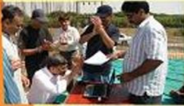
ભી.એ.સી. સર્વિસ પ્લોટ, પાલખોલ પોલોસ્ટી-બી, પોંપરા