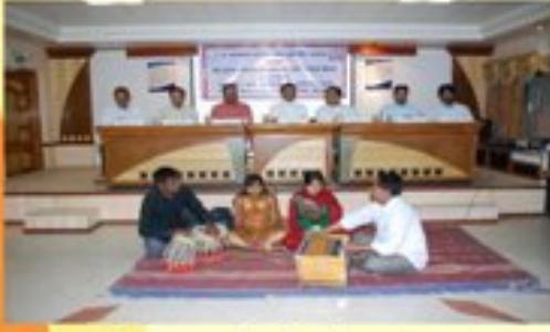
અભિમુક્તા કાર્યક્રમની પ્રાર્થના