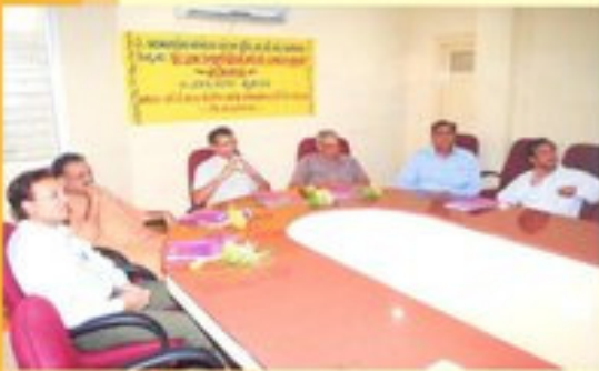
બી.એડ. પ્રોગ્રામ ઈન્ચાર્જશ્રીઓનો સેમિનાર